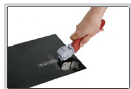
paso 1: hacer cortes de rejilla en la superficie