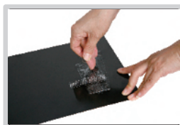
paso 2: pegar y retirar la cinta