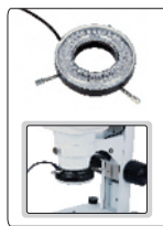
Anillo de luz LED (opcional)