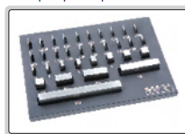
Bloques patrón para 7353-160