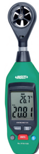
Medida de la app